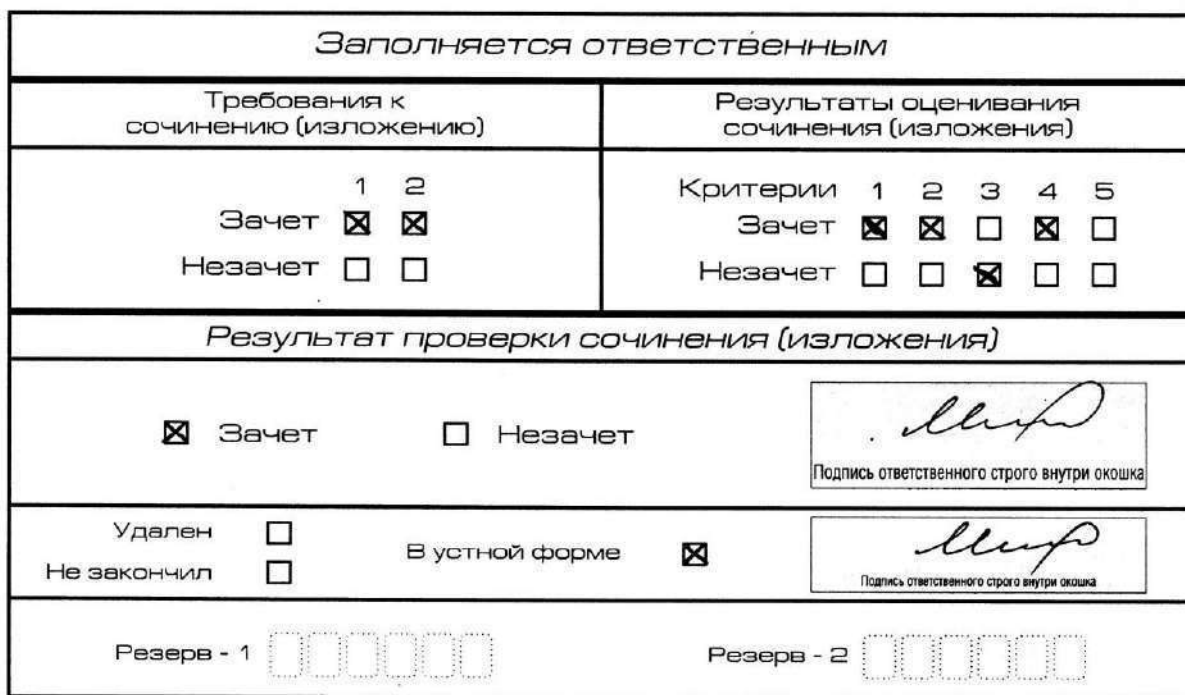
Рис. 11. Область для оценки работы сочинения (изложения) в устной форме

После окончания заполнения бланка регистрации ответственное лицо ставит свою подпись в специально отведенном для этого поле.