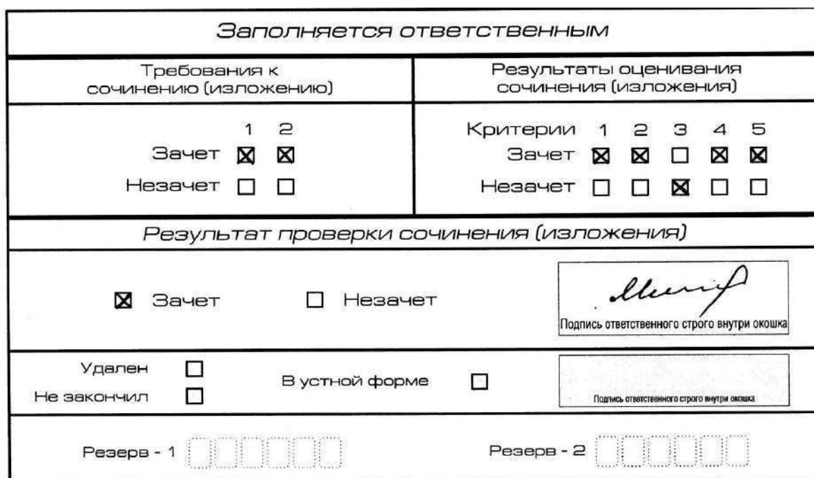
Рис. 10. Область для оценки работы

3. Во всех остальных случаях итоговое сочинение (изложение) проверяется по всем пяти критериям и оценивается по системе «зачет»/«незачет».