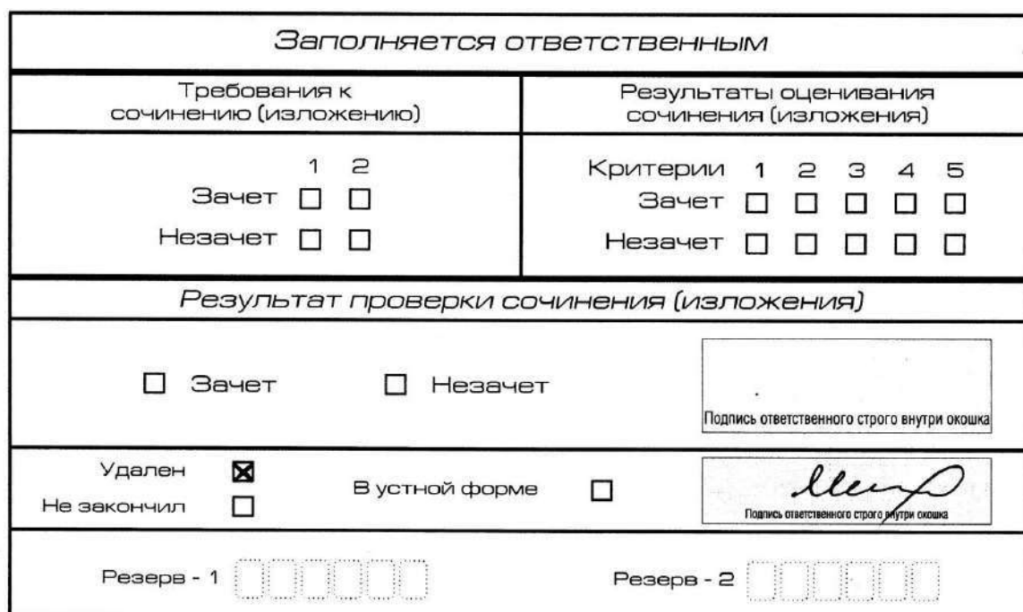
Рис. 13. Заполнение полей нижней части бланка регистрации (удаление с экзамена)

В случае если участник итогового сочинения (изложения) нарушил установленные требования, изложенные в пункте 28 Порядка проведения государственной итоговой аттестации по образовательным программам среднего общего образования (приказ Минпросвещения России и Рособрнанадзора от 4 апреля 2023 г. № 232/551), он удаляется с итогового сочинения (изложения). Член комиссии по проведению итогового сочинения (изложения) составляет «Акт об удалении участника итогового сочинения (изложения)» (форма ИС-09), вносит соответствующую отметку в форму ИС-05 «Ведомость проведения итогового сочинения (изложения) в учебном кабинете ОО (месте проведения)» (участник итогового сочинения (изложения) должен поставить свою подпись в указанной форме). В бланке регистрации указанного участника итогового сочинения (изложения) необходимо внести отметку «Х» в поле «Удален». Внесение отметки в поле «Удален» подтверждается подписью члена комиссии по проведению итогового сочинения (изложения) (см. рис. 13).